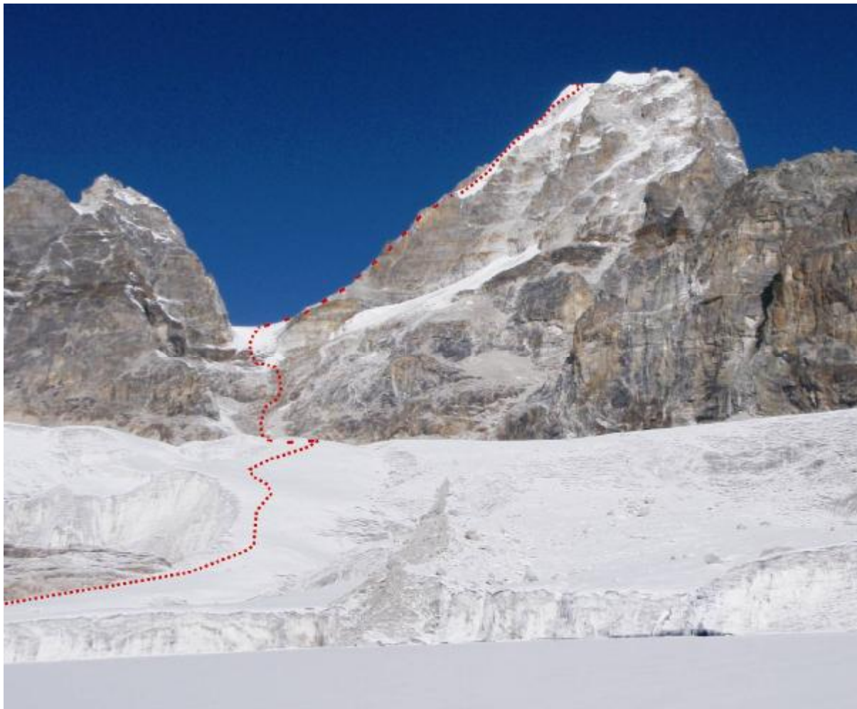
3. Pav. Kyajo viršūnė nuo Kyajo ledyno (pietinė pusė).

Pirmieji į viršūnę 2002m įkopę prancūzai kopimo dieną įvertino D kategorija pagal prancūzišką alpinistinių įkopimų klasifikavimo sistemą. Duomenų apie maršruto kategoriją pagal UIAA arba rusišką klasifikaciją nėra. Patys maršrutą vertintume 4B, dėl aukščio gal siektų ir 5A pagal rusišką sistemą.