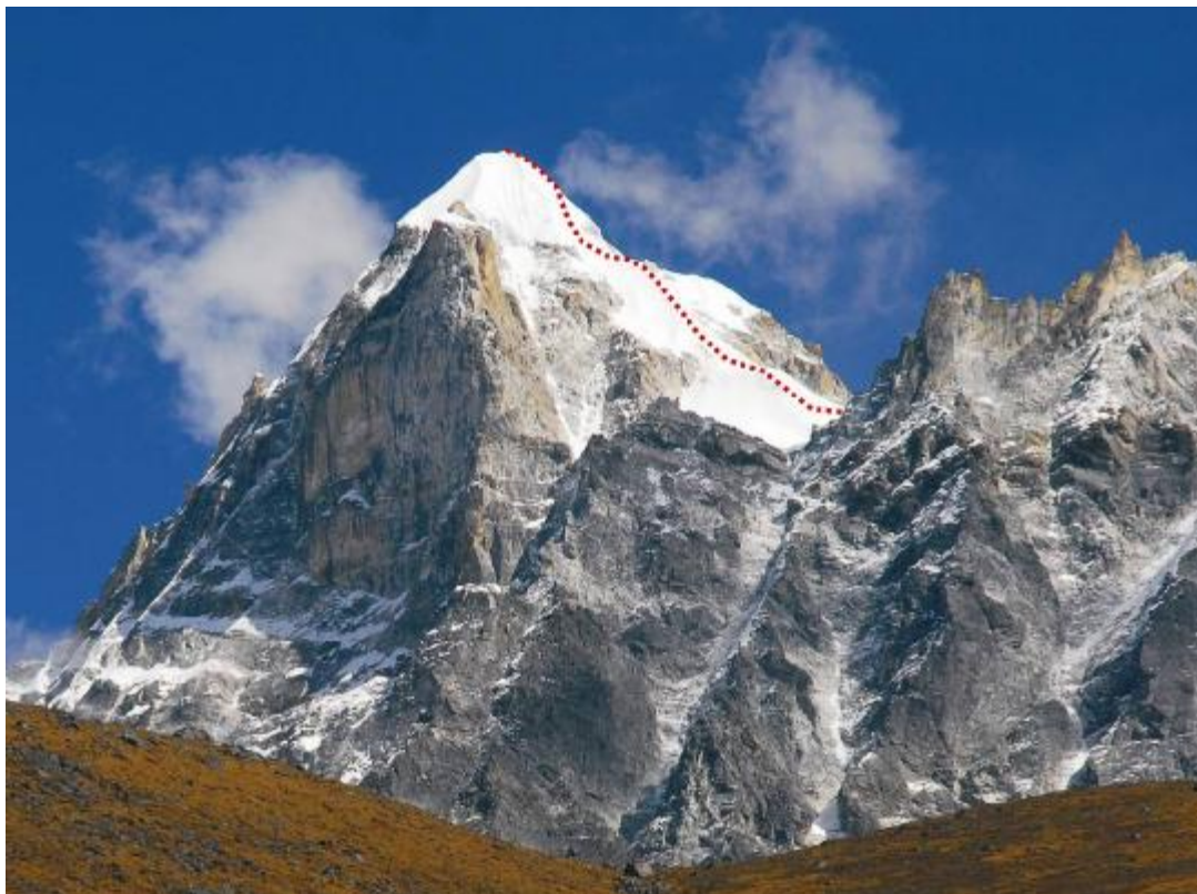
4. Pav. Kyajo viršūnė iš vakarų pusės (nuotrauka daryta aklimatizacinio žygelio metu).