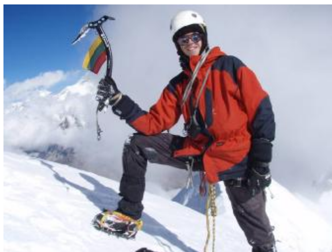
6. Pav. Ant viršūnės