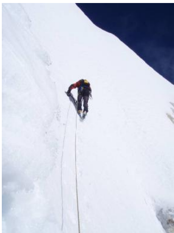
5. Pav. Lipant į viršūnę